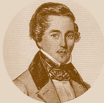
Nuori radikaali J.V. Snellman 1840.

Järjestäjät: Suomen Filosofinen Yhdistys, Suomen Historiallinen Seura, Suomalaisen Kirjallisuuden Seura, Suomen Oppihistoriallinen Seura, Helsingin yliopiston Tutkijakollegium.