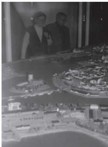
Viipurin valtava pienoismalli antaa tarkan kuvan kaupungista kohtalon hetkellä 30.11.1939.