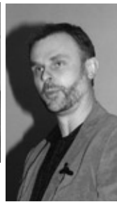
Märten Hårdstedtin mukaan leivänpala – tai pelko niiden loppumisesta – vaikutti paljon sotasotimiin