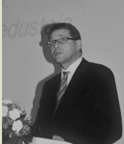
Pääministeri Matti Vanhanen avasi kymmenen suomalaisen historiapäivien.

meillä on ollut taipumusta korostaa kahta rinnakkaista perinnettä vuosien 1808 ja 1809 tapahtumien muistamisessa. Yhtäältä on John Ludvig Runebergin hengessä korostettu sankarillista taistelua Suomen sodassa. Toisaalta on painotettu Porvoon valtiopäiviä, keisarin kaukonäköisyyttä ja realismin merkitystä Suomen politiikassa. Tämän hetken tutkimus taas näyttää analysoivan, miten tosiasiaa kansainvälinen kehitys, Aleksanteri I:n valistusaatteet, sota, suomalaisten aloitteellinen valtiomiestaito ja tuon ajan johdon sekä kansan poliittiset ja moraaliset ristiriidat kietoutuivat kokonaisuudeksi.”