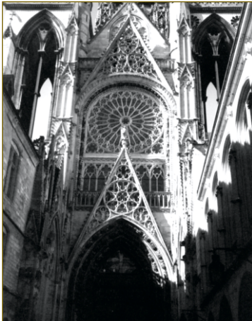
Onko gotiikka liian koreaa?

täijistä, mutta tilaa oli runsaasti. Suomalaiseen koukkaustaktiikkaan koulutettu hämmästeli, miten jenkit ja britit olivat kahlanneet murhaavassa tulella maihin ja sitten kivunneet ylös jyrkkiä rantatörmä. Erinomainen maihinnousumuseo Caenissa toki kertoi, miten valtava ilma- ja tuliylivoima liittoutuneilla oli. Ajelu Normandian mutkikkailta, muurien reunustamilla kujilla toisaalta antoi aavistaa ”pensassodan” vaikeudet.