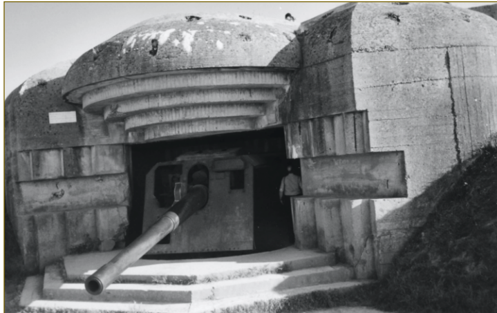
Atlantin vallin bunkkerit eivät estäneet 1944 maihinnousua.

täijistä, mutta tilaa oli runsaasti. Suomalaiseen koukkaustaktiikkaan koulutettu hämmästeli, miten jenkit ja britit olivat kahlanneet murhaavassa tulella maihin ja sitten kivunneet ylös jyrkkiä rantatörmä. Erinomainen maihinnousumuseo Caenissa toki kertoi, miten valtava ilma- ja tuliylivoima liittoutuneilla oli. Ajelu Normandian mutkikkailta, muurien reunustamilla kujilla toisaalta antoi aavistaa ”pensassodan” vaikeudet.