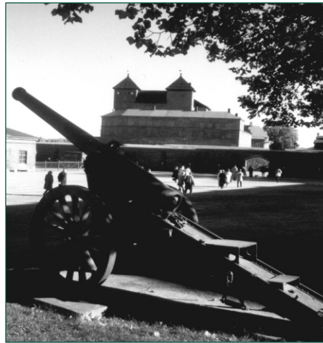
Keskiaikaisen linnan ympärille nousseet vankilat ja kasarmit tarjoavat nykyään tilat monille kiinnostaville museoille.

Ainutlaatuinen nähtävyys on Vankilamuseo, jossa entinen lääninvankila on säilytetty pääpiirteissään entisellään. Nuoriso tuntee tietenkin parhaiten amerikkalaiset vankilat kysyen elokuvista tai Aku Ankasta tuttuja ristikkovia, raitapukuja tai jalkaan kiinnitettävää rautapalloa. Ne eivät ole kuuluneet koskaan suomalaiseen kriminaalipolitiikkaan, jossa vankilan rakentamisaikaan pyrittiin parantamaan rikollisia ahkerralla työllä, ajan mittapuun mukaan siedettävillä asumisololoilla ja sielunhoidolla.